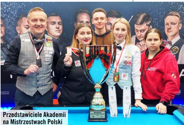
Przedstawiciele Akademii na Mistrzostwach Polski