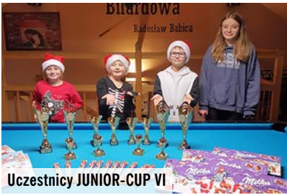
Uczestnicy JUNIOR-CUP VI