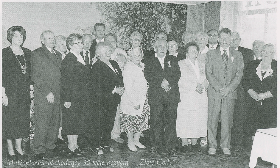
Małżonkowie obchodzący 50-lecie pożycia – „Złote Gody”

Spośród 11 par małżeńskich obchodzących „Rubinowe Gody” w uroczystości udział wzięło 8 par. Natomiast spośród 31 par małżeńskich obchodzących „Perłowe Gody” w uroczystości uczestniczyły 22 pary. Jubilaci Ci otrzymali z rąk Przewodniczącego Rady Gminy oraz Wójta Gminy Rokietnica „Listy Gratulacyjne” wraz z wiązanką kwiatów.