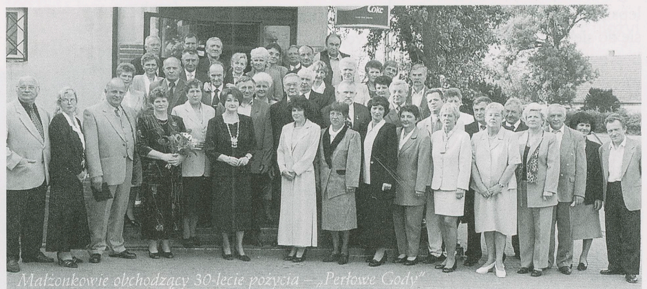
Małżonkowie obchodzący 30-lecie pożycia – „Perłowe Gody”

Wszyscy świętowali przy lampce szampana i poczęstunku.