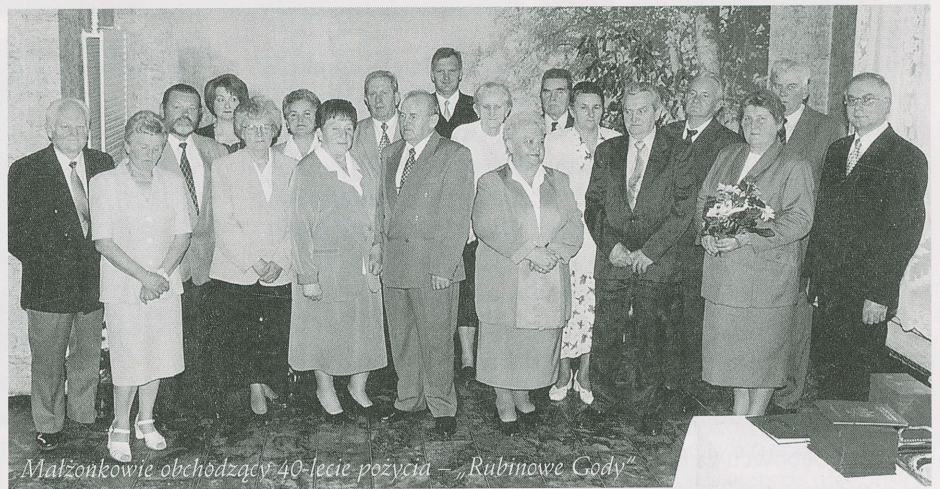
Małżonkowie obchodzący 40-lecie pożycia – „Rubinowe Gody”