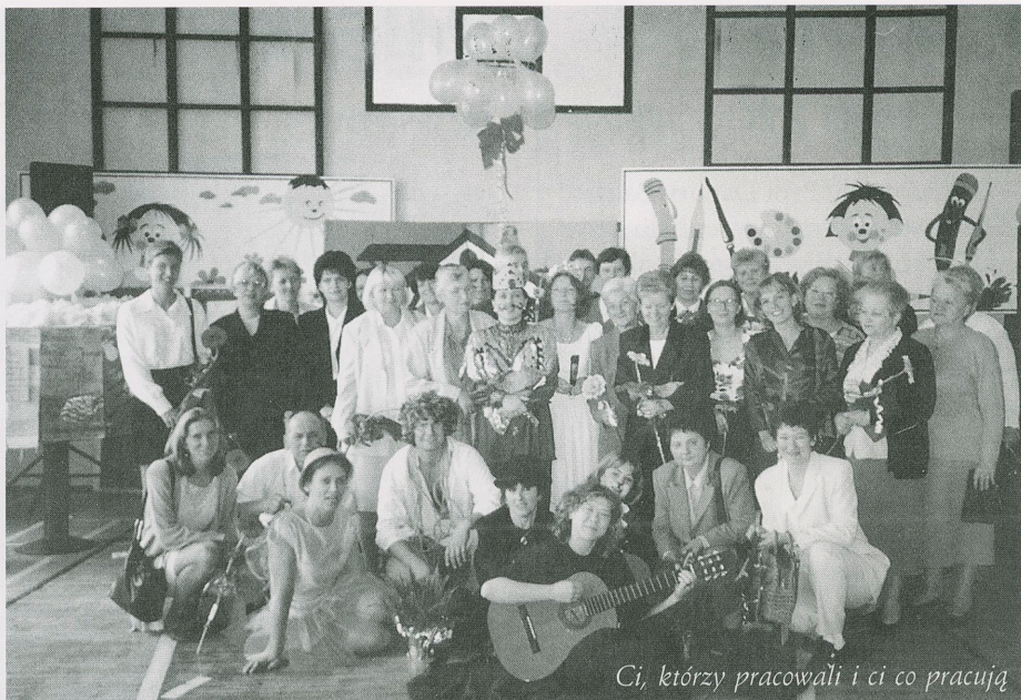
Ci, którzy pracowali i ci co pracują

„W korytarzu stoi kaczka nie dziwaczka lecz sprzątaczką i już idzie na boisko By posprzątać to śmietnisko Wnet połyka wszystkie śmieci, które wyrzucali dzieci. I odkurzacz ruszył już By posprzątać szkolny kurz By przed szkołą oczywiście Pozamiatać wszystkie liście Ścierka, gąbka, szczotka, szmatka To dla naszej kaczki gratka Wszystkie lasy lśnią przejrzyście To przez kaczkę oczywiście z tego wiersza morał taki DO SPRZĄTANIA DUŻE PTAKI! ”