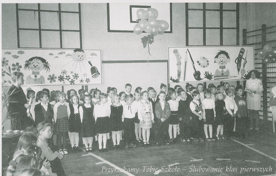
Przyrzekamy Tobie Szkoło - Ślubowanie klas pierwszych