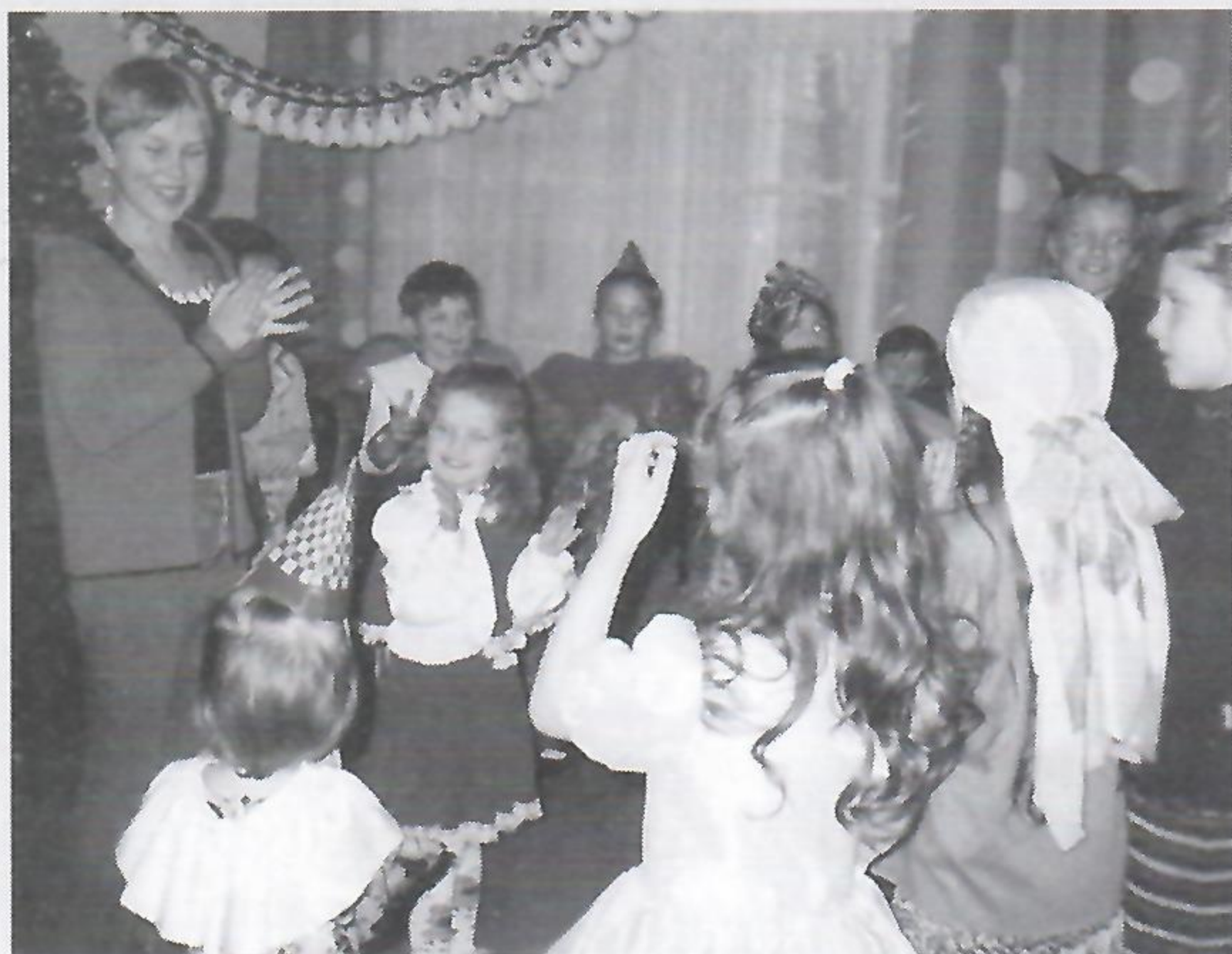
Diablica, Wróżka, Pajac... to jedni z wielu uczestników baliku