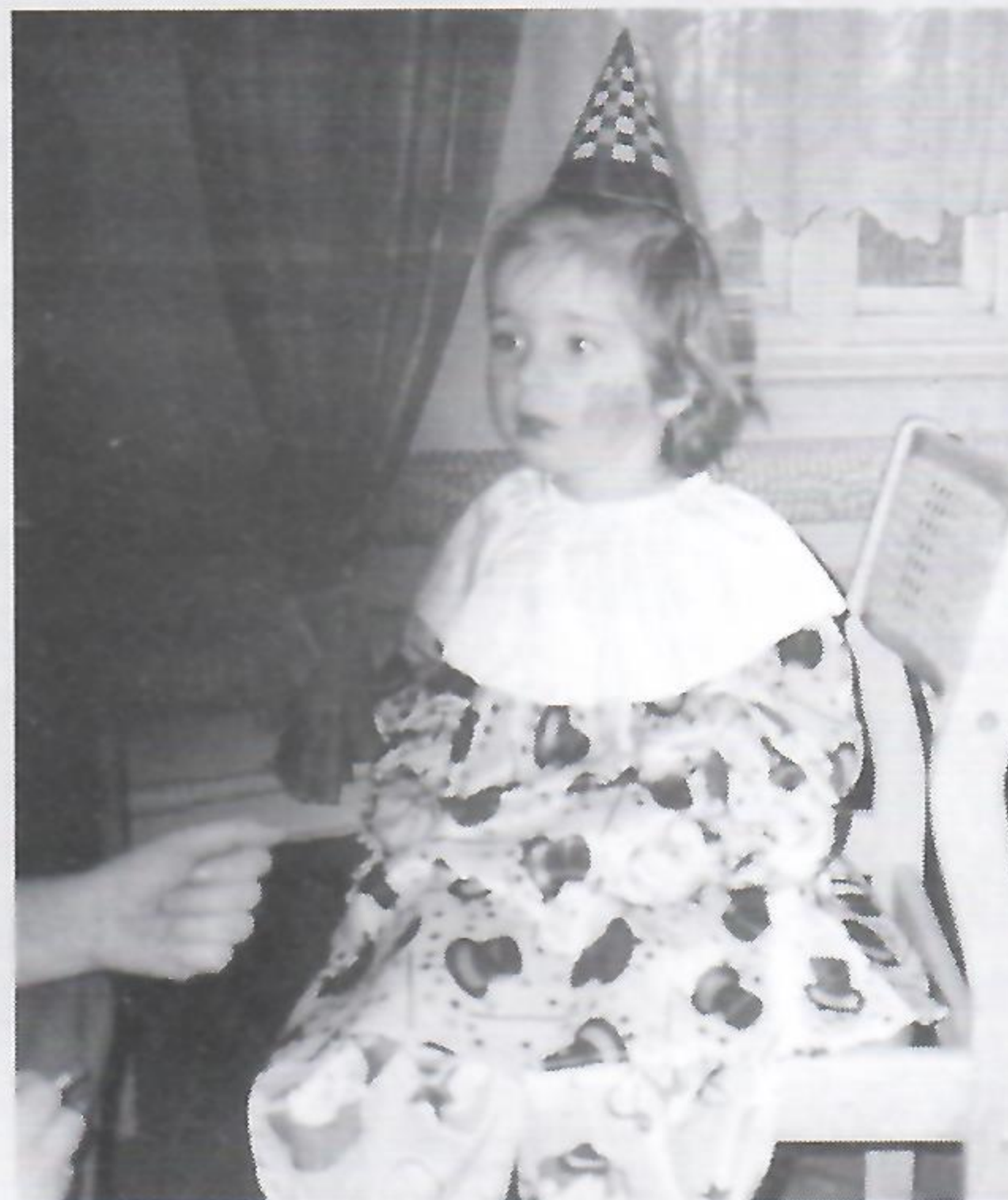
I co teraz będzie?