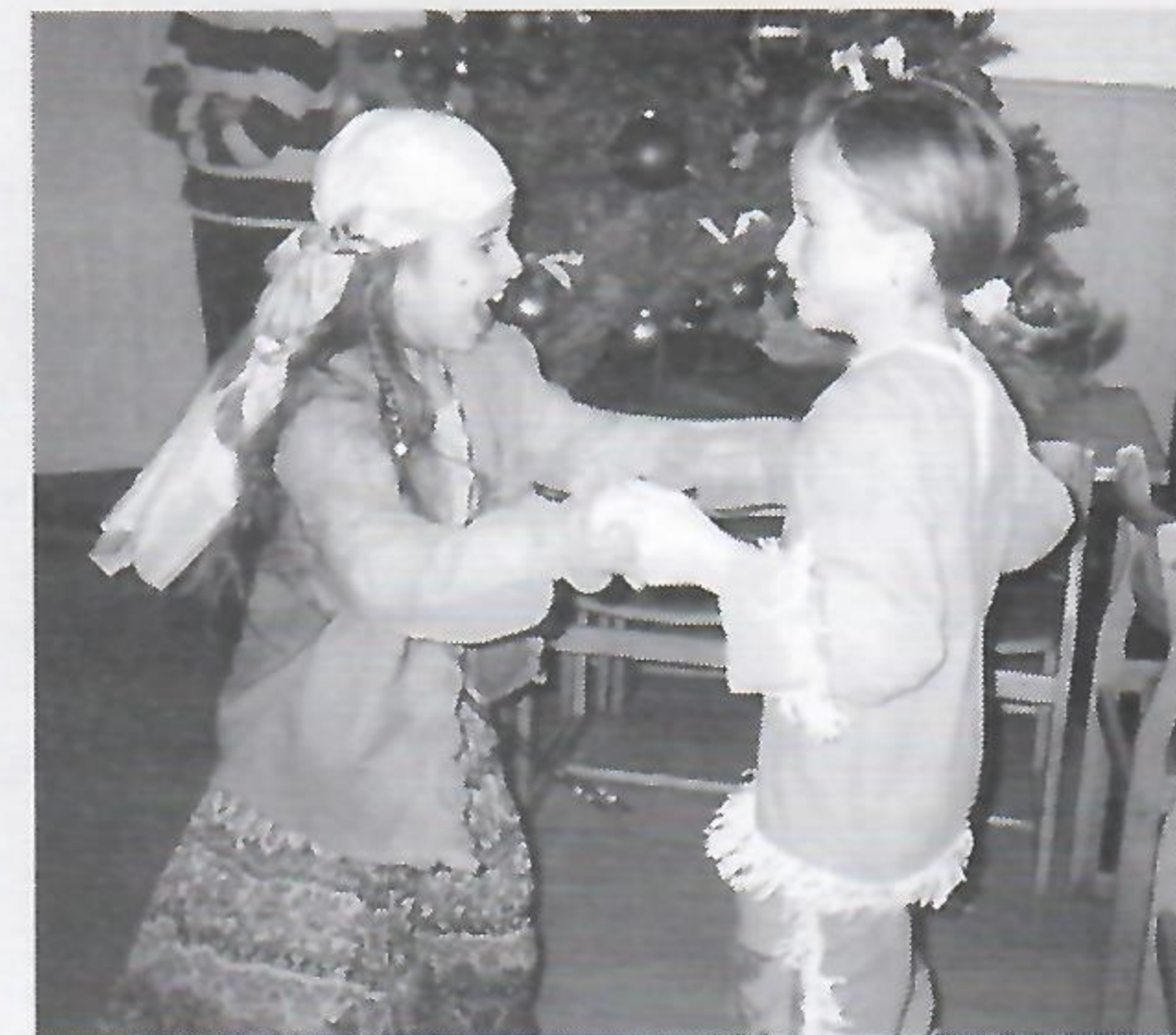
Na rozbawionej parze nawet piękna choinka nie robi wrażenia