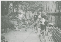
Fot.2. Rajd do Chłudowa

„Kolo Turystyki Rowersowej” - szlak dołży.