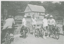
Fot.3. Rajd do Objezierza