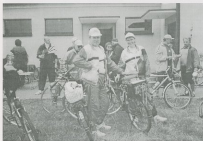
Fot.1. Rajd do Ceradza Kościelnego