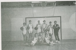
Reprezentacja Szkoły Podstawowej Mrowina w piłce koszykowej dziewcząt

Ciąg dobry - Sportowe podsumowanie roku.